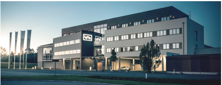
LEHA Stammsitz in Breitenbach, OÖ.