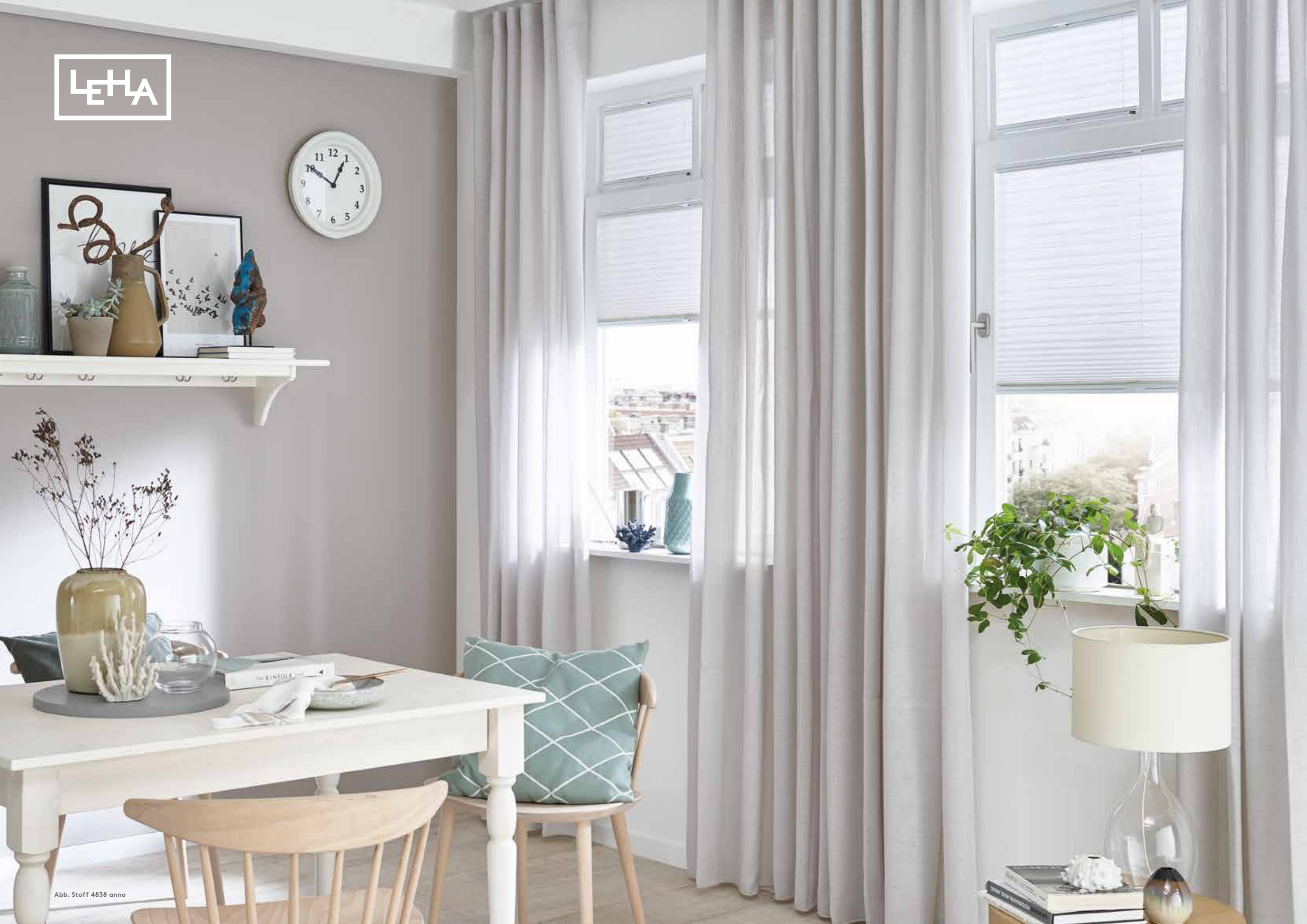
Abb. Stoff 4838 anno