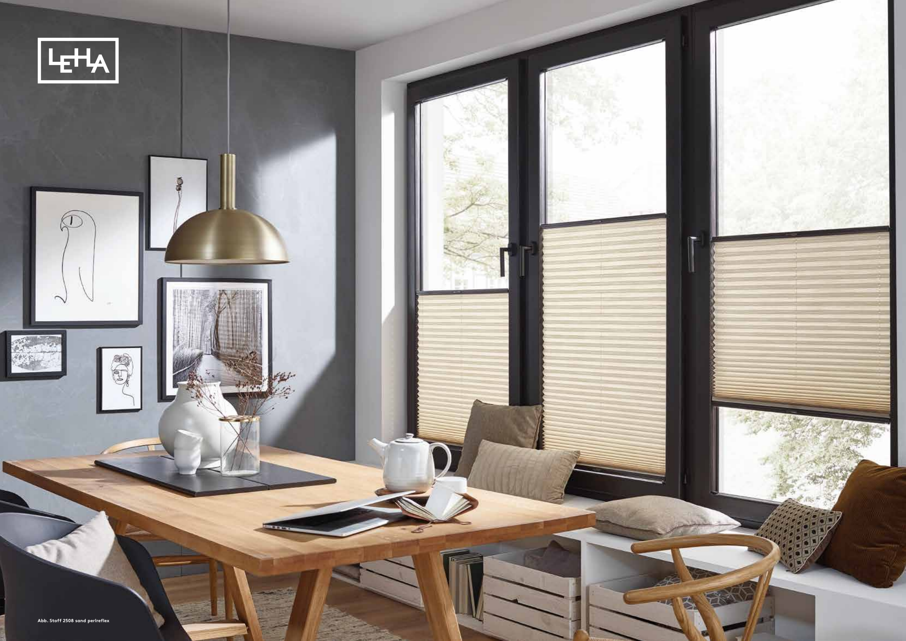
Abb. Stoff 2508 sand perreflex